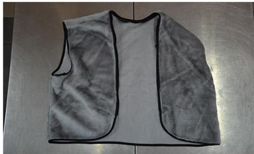
冬季藍色夾克內襯