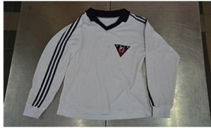
秋季運動服上衣正面

運動服：最低購買數量為2套，若日後有需要，合作社也能購買此商品(尺寸不一定齊全)