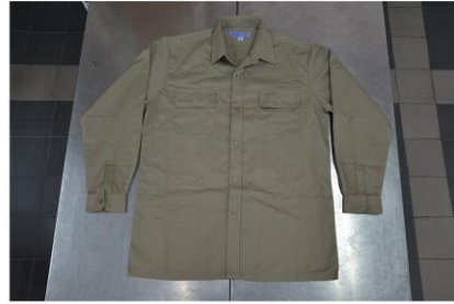
秋季制服卡其上衣(男生)