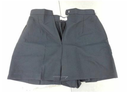
夏季制服褲裙(女生)