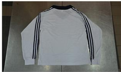
秋季運動服上衣背面