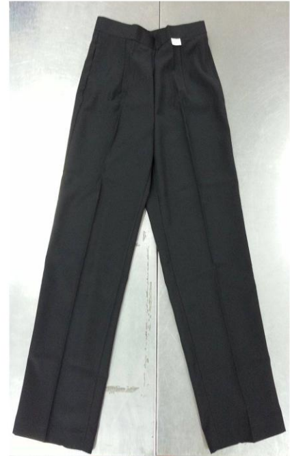
秋季黑色制服長褲(女生)