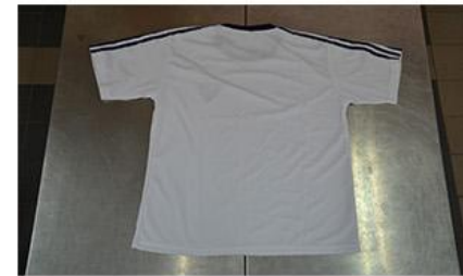
夏季運動服上衣背面