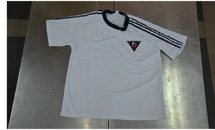
夏季運動服上衣正面