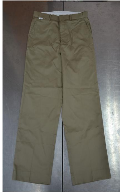
秋季制服卡其長褲(男生)