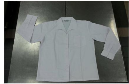
秋季白色長袖上衣(女生)