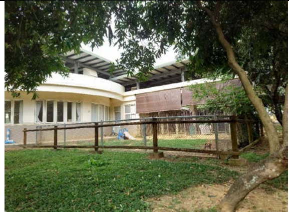
狗狗散放草地外觀