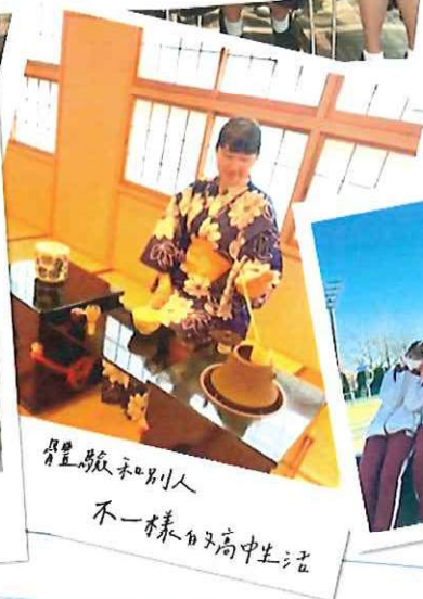
尊重自己和別人 不一樣的又高中生活