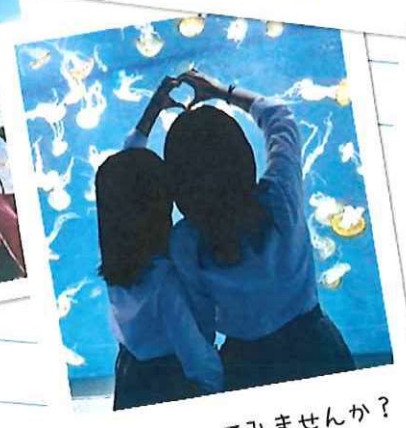
日本留學してみませんか?