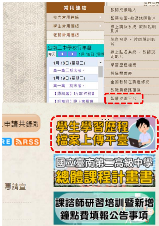
新學習歷程系統入口如左圖