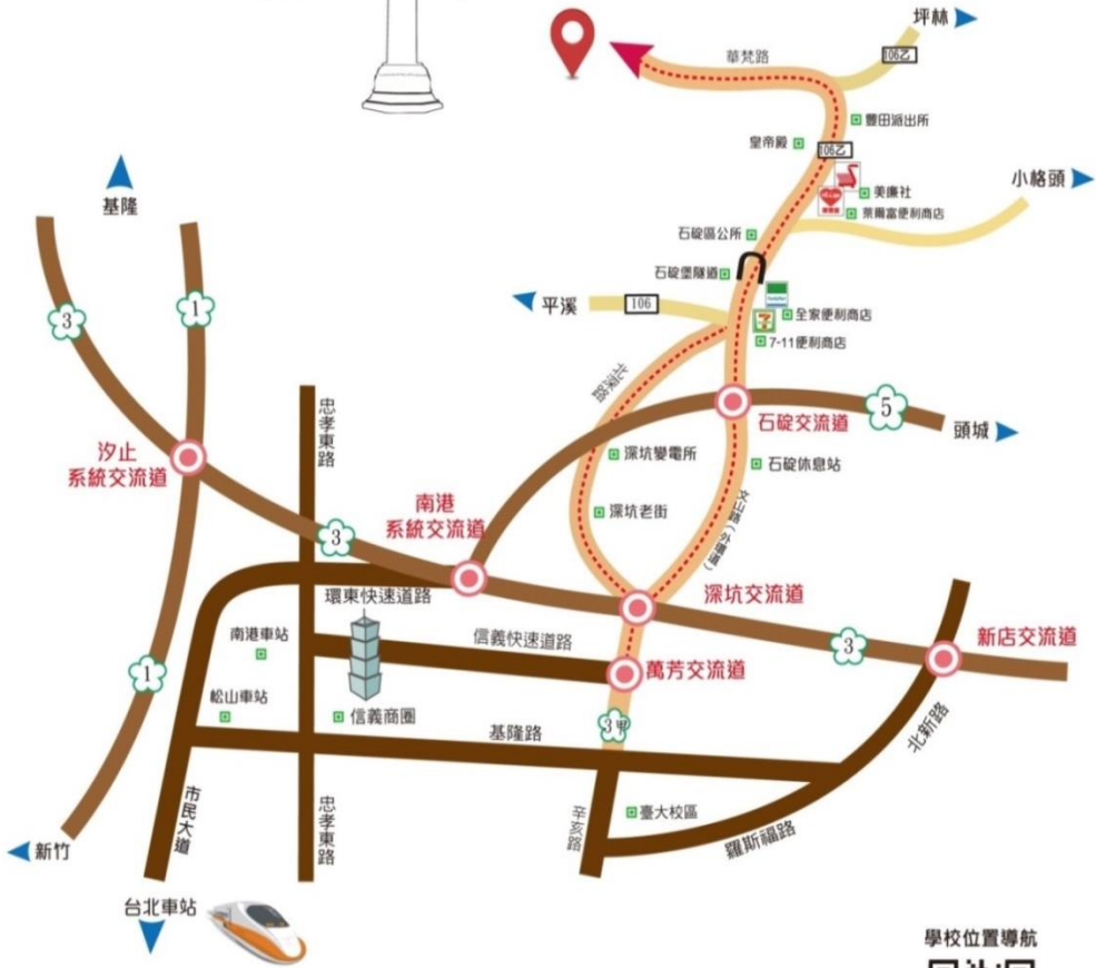
■ 華梵大學交通路線圖